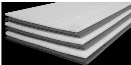
Вомлекс НПЭ в матах