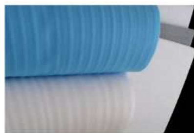
Вомлекс НПЭ - продукция