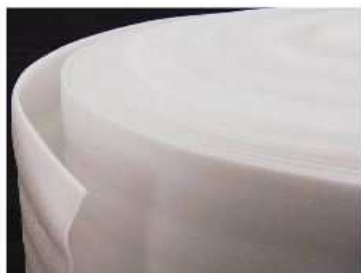
Вомлекс НПЭ в рулонах

Минимальная сумма отпуска товара - от 2 000 руб.